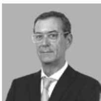
Miguel Guimarães Orador Deputado à Assembleia da República

Pontos de Discussão: Estratégias para recrutar, manter e apoiar os profissionais de saúde, incluindo formação, apoio à saúde mental e evolução de carreira. O papel das migrações internacionais na resolução de problemas de escassez de mão de obra e respetivas implicações éticas.