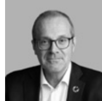
Hans Kluge Diretor Regional da OMS para a Europa