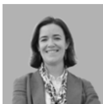
Ana Povo Conferencista Secretária de Estado da Saúde

A conferência “Governação Global na Saúde tratará o alinhamento da cooperação internacional com as prioridades nacionais” abordará o equilíbrio entre os compromissos globais e as necessidades dos países, garantindo a equidade e melhorando a governação para políticas de saúde sustentáveis. Os desafios globais no domínio da saúde, como as pandemias, as alterações climáticas e as desigualdades na saúde, exigem respostas coordenadas, mas continua a ser difícil alinhar os quadros internacionais com as prioridades nacionais. Esta conferência debaterá estratégias para melhorar a governação, o financiamento e a coerência das políticas, respeitando simultaneamente a soberania nacional.