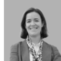
Ana Povo Secretária de Estado da Saúde