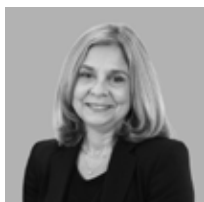
Ana Paula Martins Oradora Ministra da Saúde de Portugal