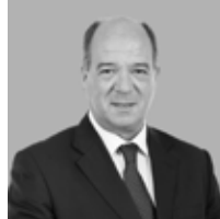
Carlos Carreiras Presidente da Câmara Municipal de Cascais