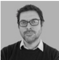
Ewout Van Ginneken Conferencista Diretor do Observatório Europeu dos Sistemas e Políticas de Saúde

A Conferência de Abertura "A Saúde Global no Século XXI: Navegar pelas Ameaças e Oportunidades Emergentes" aborda as principais questões de saúde global, como as doenças infecciosas, a resistência antimicrobiana e o impacto das alterações climáticas incentivando soluções inovadoras e a cooperação global. A conferência debaterá o reforço dos sistemas de saúde, a utilização da tecnologia e a preparação para futuras crises tendo como objetivo promover a resiliência e a equidade na saúde mundial.