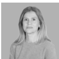
Cristina Vaz Tomé Oradora Secretária de Estado de Gestão da Saúde

A conferência “Sustentabilidade dos Sistemas de Saúde: Desafios para o Futuro” reúne especialistas, decisores políticos e líderes do sector da saúde para debater os obstáculos à manutenção de sistemas de saúde sustentáveis. Os temas incluem a resiliência financeira, os desafios da mão de obra, a transformação digital e as políticas de acessibilidade e eficiência a longo prazo. Os sistemas de saúde a nível mundial estão sob pressão devido ao envelhecimento da população, ao aumento dos custos e às ameaças emergentes para a saúde. A sustentabilidade exige investimento estratégico, tecnologias inovadoras e políticas adaptáveis. Esta conferência explora a otimização dos recursos, a melhoria da governação da saúde e o equilíbrio entre cuidados de qualidade e viabilidade económica. Ao promover a colaboração e a visão de futuro, o evento tem como objetivo criar sistemas de saúde resilientes que garantam cuidados equitativos e eficazes para todos.